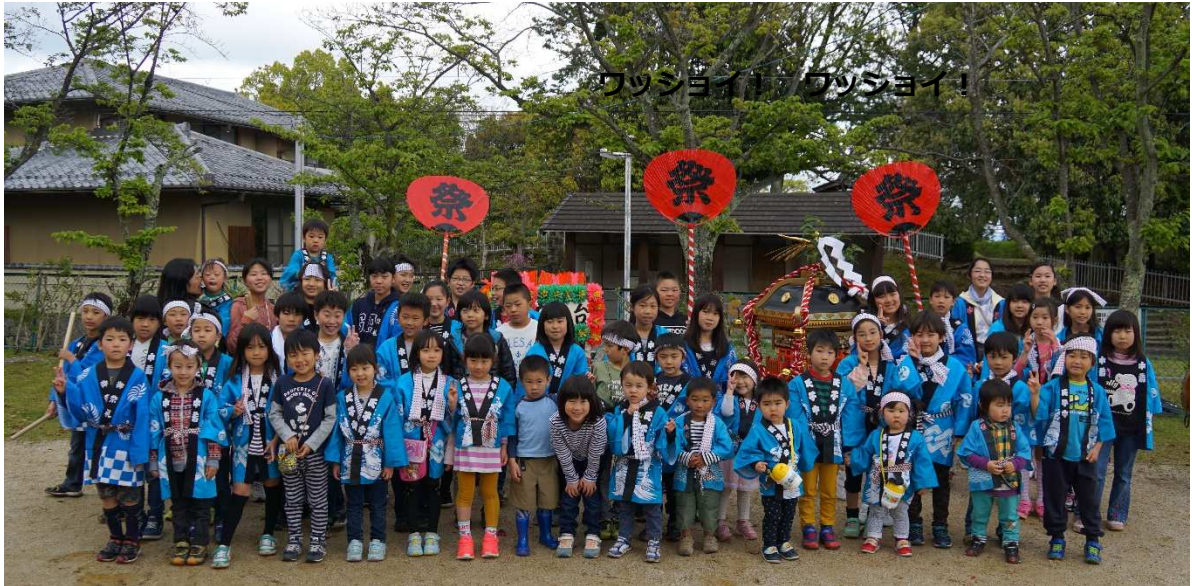
最後はみんなで記念撮影！（南公園で）