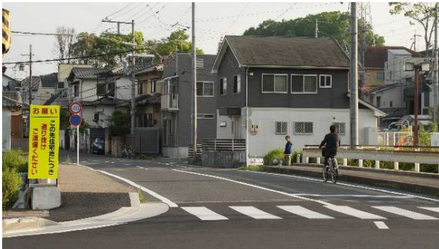
衣川台北進入路、明神橋：お願い看板

3月18日、自治会総会の後、県道仰木本堅田線整備工事の終了が近いことから、日曜日にも関わらず大津市職員の方から簡単な説明がありました。