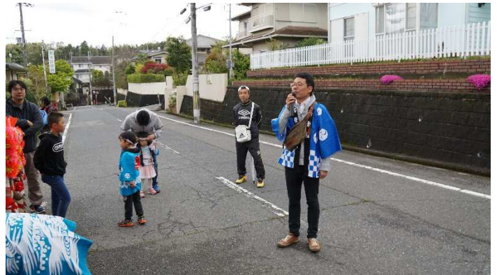
自治会長の挨拶 (ここだけの話、実は天満宮で、しこたま飲まされて、だいたい気持ちの会長)