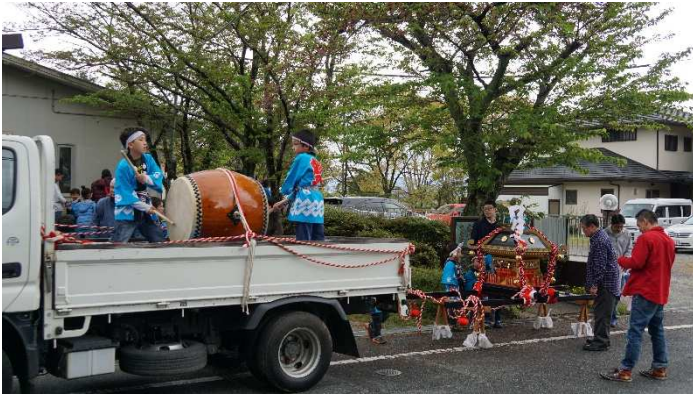
ふれ太鼓も一緒に いざ出発！

いよいよ春祭り本番！ 当たらずにいいのに予報通り朝から雨、雨、雨・・・天満宮のお祭りも中止になり、どうする御神輿ワッショイ？ 子供達が楽しみにしているのに・・・自治会長と文体部長の決断！ ふれ太鼓は取り敢えず中止。何とか御神輿だけでも・・・その思いが通じたのか、雨がやんだ！！ それ、今のうちだ！