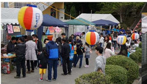
人が集まってきました！