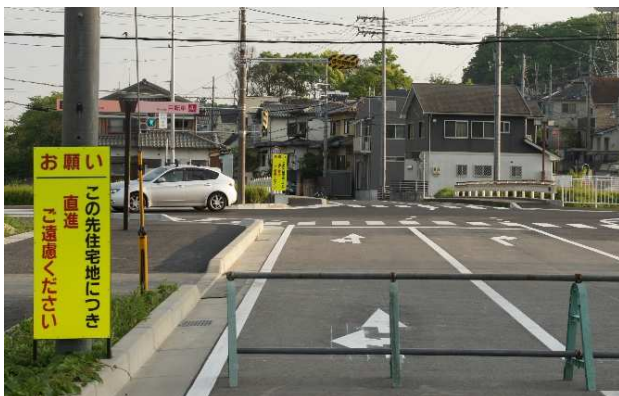
堅田駅から衣川台へ：明神橋交差点手前にもお願い看板