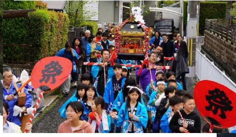
ワッショイ！ ワッショイ！