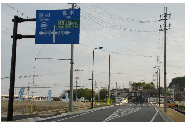
堅田駅から衣川台へ：お願い看板の手前に道路標識 左:堅田、右:仰木・湖西道路、直進は何も書かれていない

自治会では、この新しい道路の影響で衣川台が、おごと温泉駅方面への抜け道になることを懸念しております。そこで、新道路開通前に衣川台の3カ所の出入り口について、交通量調査を実施しました。開通後、再度調査を実施し、著しく交通量が増加していないか、見守ってゆきます。