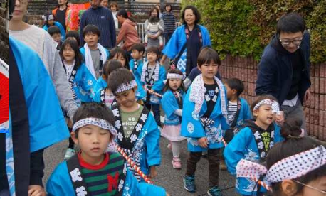
小さい子もワッショイ！