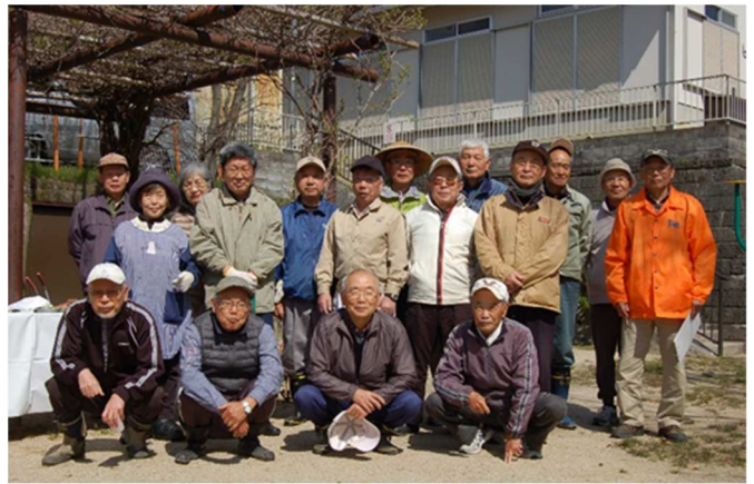
平成 30 年 4 月の南公園日常維持管理作業参加者

平成 14 年 3 月拠出金を持ち寄り発足した公園愛護会も、会員はもとより多くの住民の皆さんのご協力により 16 年を経過した現在、拠出金を返還し安定した運営を行っています。平成 23 年度には、衣川台老人クラブと共同で衣川台南自治会館に「会議用テーブル（折りたたみ式）」20 脚を寄贈した他、平成 24 年 12 月には大津市長から「第 6 回煌めき大津環境賞」を受賞するなど、公園愛護会の活動状況は衣川台にとって重要な位置づけとなっています。