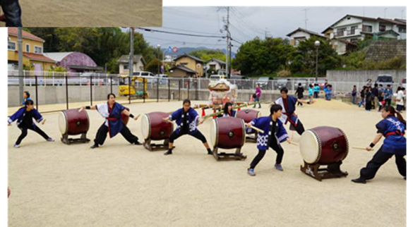
仰木台太鼓クラブ 湖鼓 RO 大迫力でした！