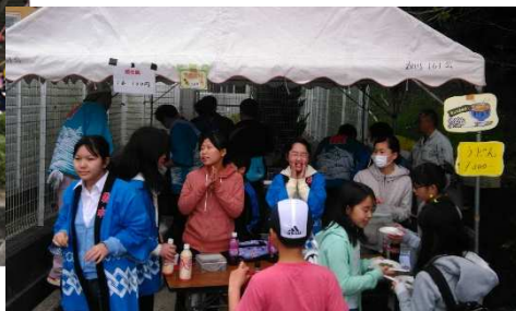
中高生 5 人がお手伝いを してくれました！