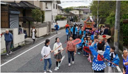
中高生もワッショイ！