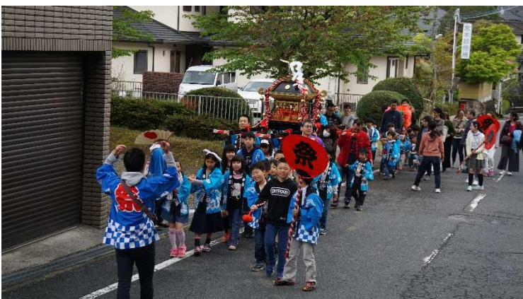
ワッショイ！ ワッショイ！