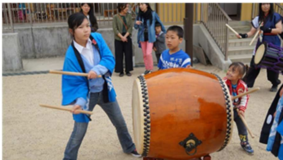
始まりました！ 各自治会の太鼓共演！