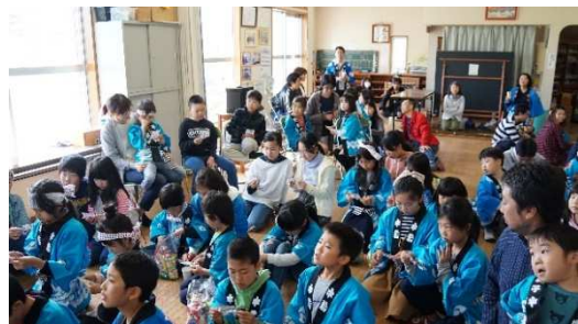
南自治会館でビンゴでワッショイ！？