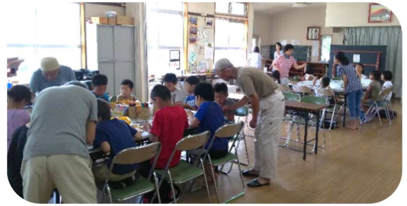
2017年の「夏休み小学生大会」の1コマ

異世代間交流を通して、楽しい衣川台・元気な衣川台を目指しています。 今年度もどうぞよろしくお願ひいたします。