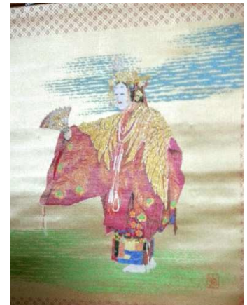
15組の宮崎画伯が綾錦織りにてデザインされた舞姿です