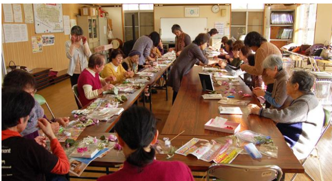
参加者 21 人がアートフラワー作りに挑戦

温かなスタッフと一緒に、地域の方々とふれあい、 身体をほぐし、心もホッコリさせませんか！ 参加費は、コーヒー、お茶、お菓子付きで100円ポッキリです。