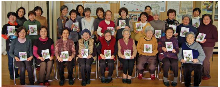
講師の先生と一緒に 「世界に一つだけの花」を手にして記念撮影

先日も「アートフラワー作り体験」があり、不器用な私も皆さんに助けられ初体験を楽しみました。