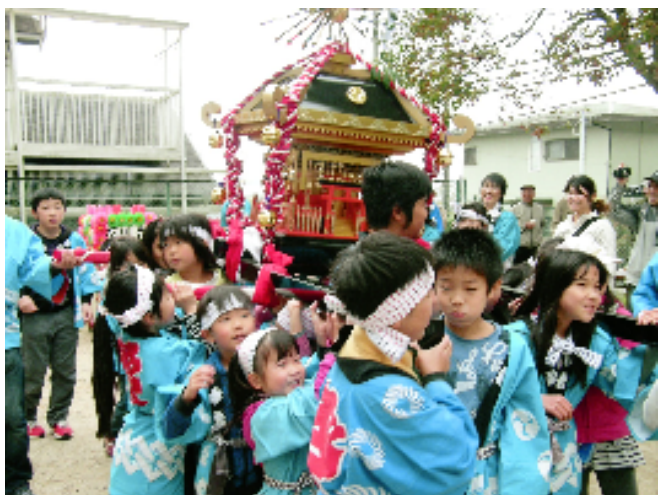
北公園でのスナップ写真。こども達だけでお神輿を担いでいますよ。みんなかっこいい！