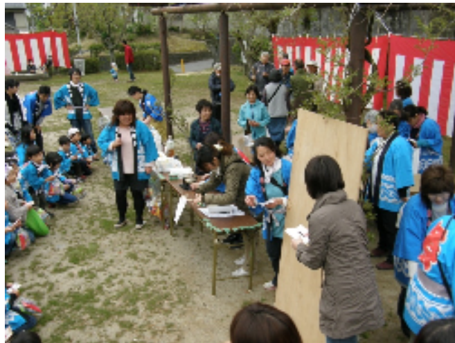
南公園到着後、お楽しみこども会のビンゴ大会がいよいよスタート!いいもの当たったかな?

最後に子供たちを中心に記念撮影。みんな来年まで楽しみに待っててね (^^)/~~~