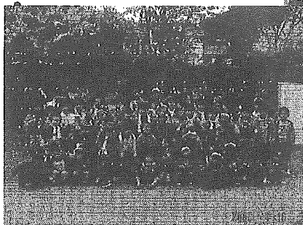
18年度役員さんお疲れさまでした