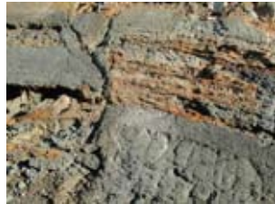
(通学路) 法面の断層

堅田断層のリスクは低いという報道もありましたが、東日本大震災や阪神淡路大震災等の大きな地震で事前に予報が出たことはありません。残念ながら、まだ地震予測することはできないのです。