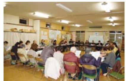
衣川台自治会平成25・26年度新旧合同役員会(平成26年2月16日)

衣川台自治会の役員選任は、平成26年3月下旬に開かれます衣川台自治会総会審議を経て決定となりますが、すでに今年度自治会役員と