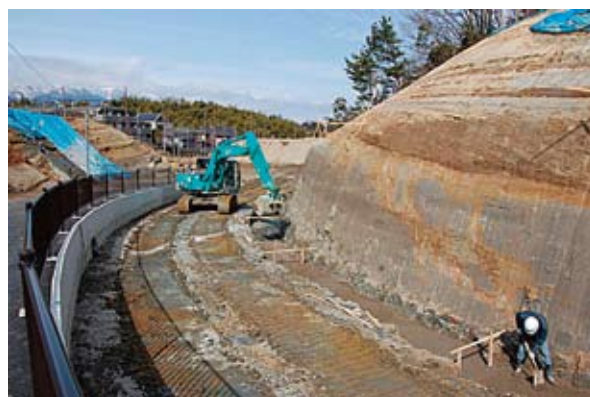
大型ショベルで作業中の第1工区車道部 (平成26年2月18日)