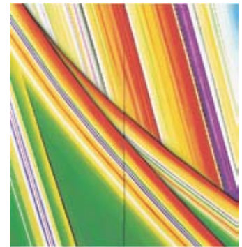
第45回日展(2013) 秋彩 宮崎芳郎

が出来る。色鮮やかなみどり色を基調にどこまでも真っ直ぐに伸びる線と線、それが交わる構図にわが衣川台老人クラブの活動が重なり合っているように思えて実に妙である。(作品参照)