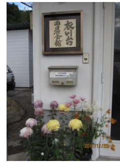
書家の堀田先生、軸丸様、青谷様